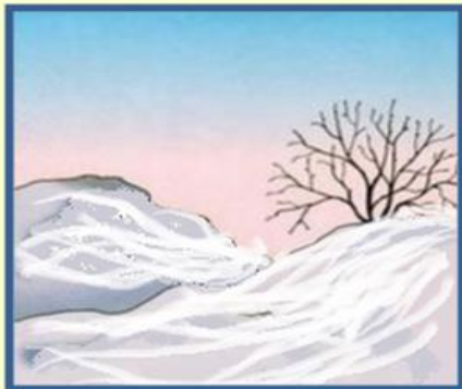
Снег покрыл землю