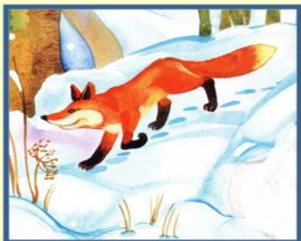
Звери меняют шубки