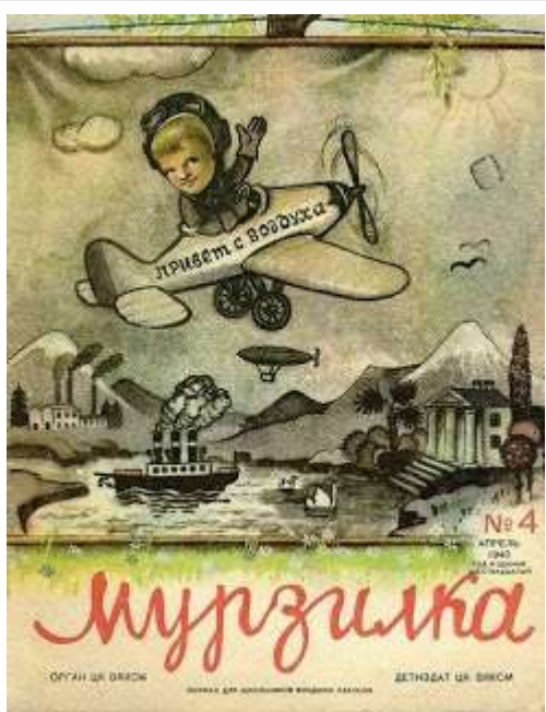
Журнал "Мурзилка" 1940 г.

Во время Великой Отечественной войны Носов режиссировал учебные военно-технические киноленты. В победном 1945 году вышел сборник Носова «Тук-тук-тук», в который вошли ранее опубликованные рассказы. Затем, один за одним, свет увидели сборники «Ступеньки», «Веселые рассказы», «Веселая семейка» и «Дневник Коли Синицына».