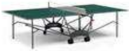
стол для тенниса