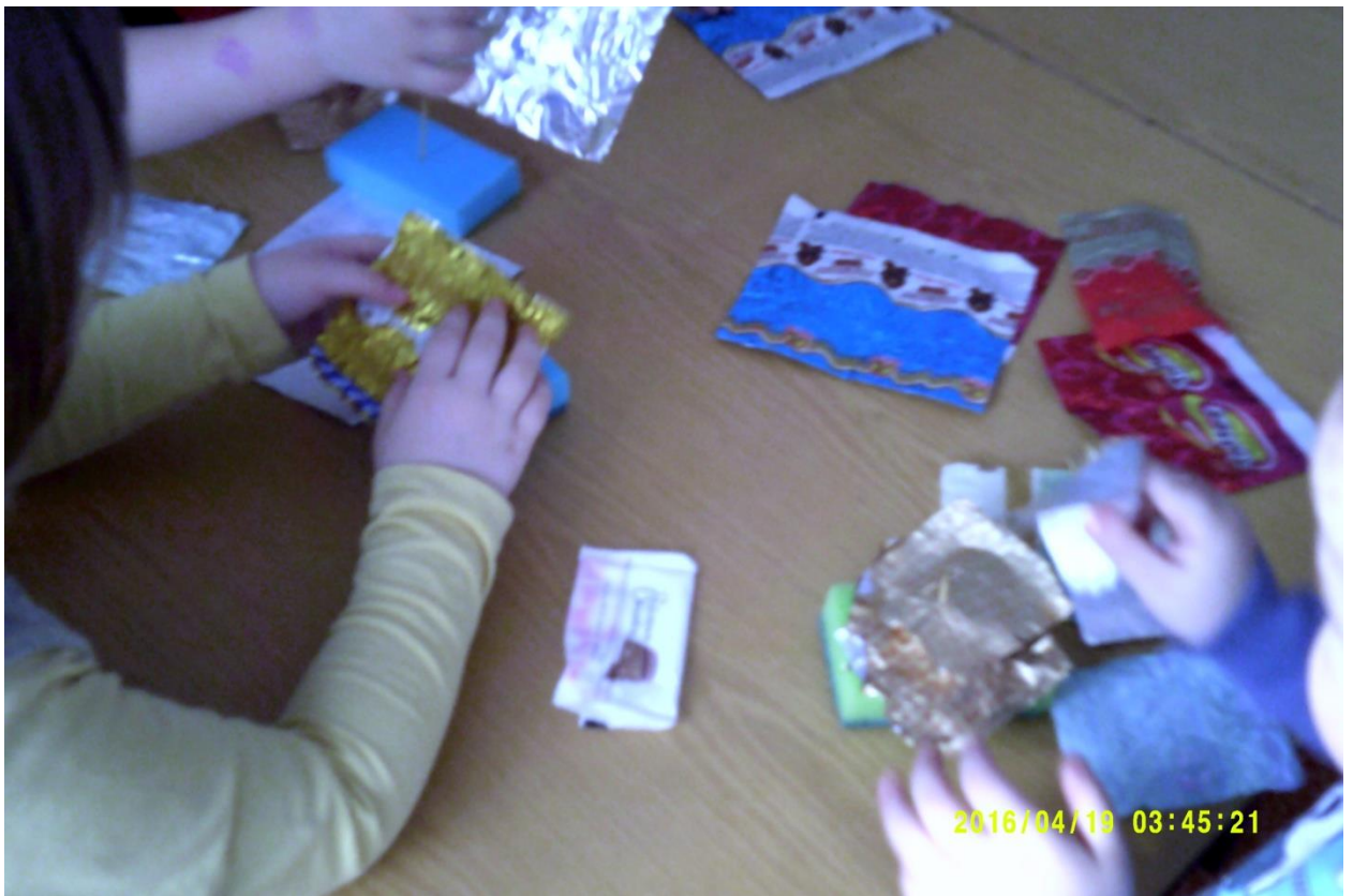
Зубочистки воткнули в губки